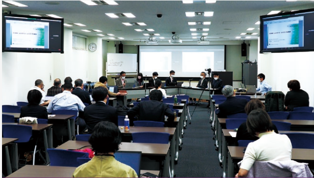
日本インターネットガバナンスフォーラム2022の様子

ティティとして、メタバース文化の発展のために講演や執筆も精力的に行っています。セッションの前半は、バーチャルYouTuberのことをよく知らない参加者のために、メタバースがどのような技術によって実現されているかについて解説がありました。その後には参加者の素朴な疑問に答える質疑応答などが続き、これまでのものとまったく異なる、メタバースの世界を垣間見ることができるセッションとなりました。