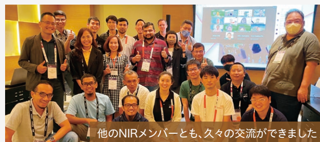
他のNIRメンバーとも、久々の交流ができました